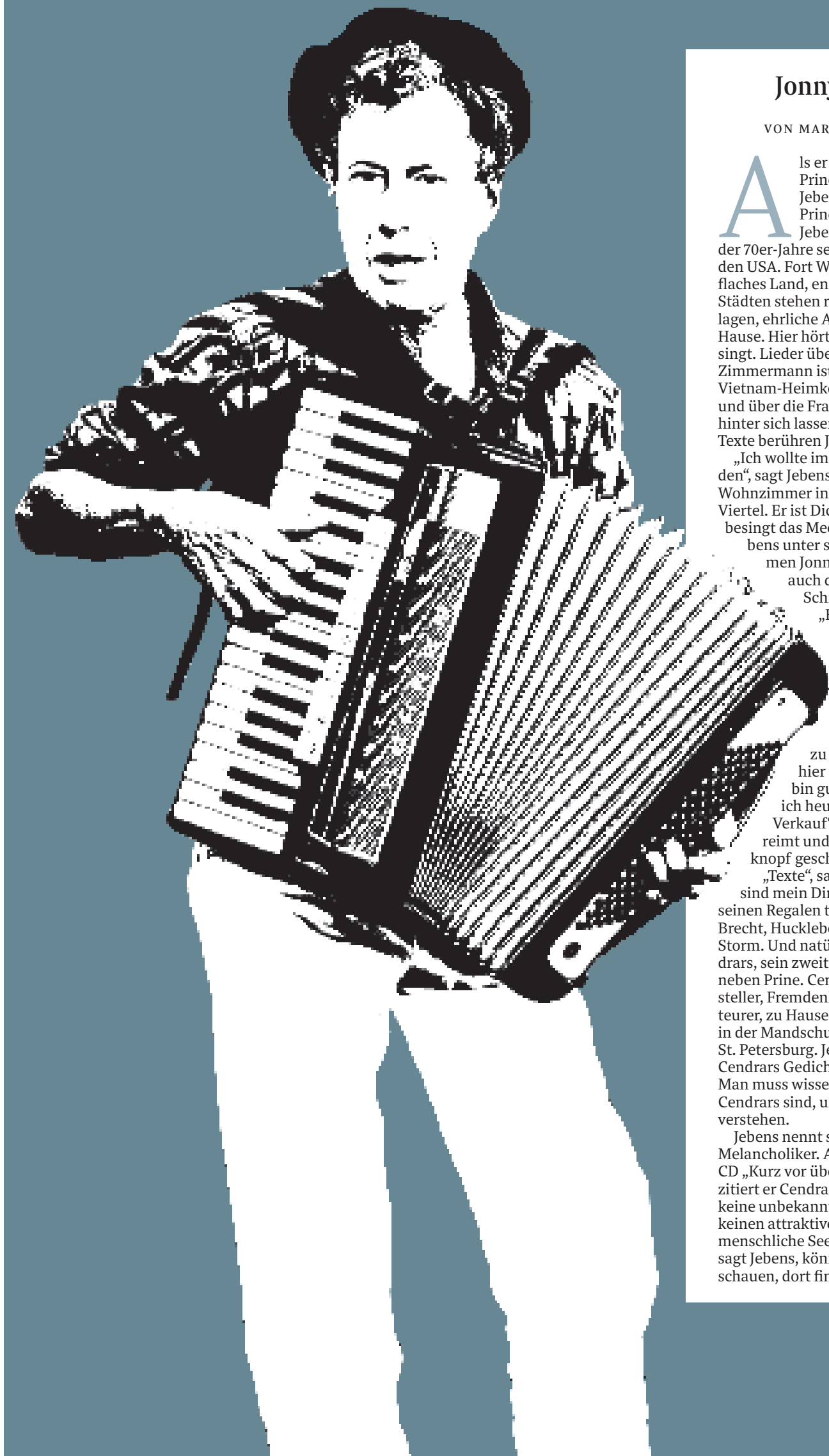
ILLUSTRATION: SCHUMANN/NACH EINEM FOTO VON CHRISTINA KUHAUPT

Sein eigenes Zuhause für sich und seine Familie hat Lütjen in Oberneuland gefunden. „Dort bin ich geboren.“ Und wie lebt ein Profi wie er? „Unaufgeregt schön“, sagt Lütjen und scheint damit ganz zufrieden zu sein. Das Haus in der Göschensstraße hat Lütjen übrigens verkauft. Nur nicht bei der ersten Besichtigung.